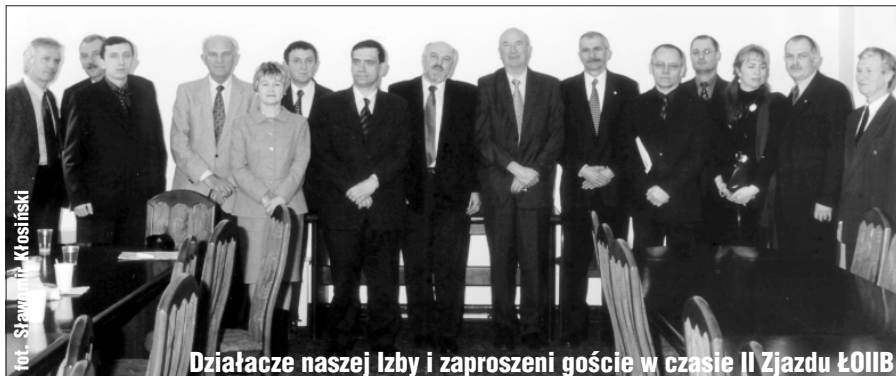
Działacze naszej Izby i zaproszeni goście w czasie II Zjazdu ŁOIIB

zawodowych architektów, inżynierów budownictwa oraz urbanistów (Dz. U. nr 23, poz. 221), na mocy której, począwszy od 31 marca 2002 r., prawo wpisywania na listę członków okręgowej izby uzyskali pełnomocnicy okręgowi powołani przez Komitet Organizacyjny Izby Inżynierów Budownictwa. Rada ŁOIIB ukonstytuowała się 4 kwietnia 2002 r., wybierając siedmioosobowe Prezydium, którego skład został powiększony w styczniu i we wrześniu br. i obecnie liczy 11 osób.