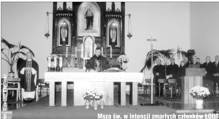
Msza św. w intencji zmarłych członków ŁOIB