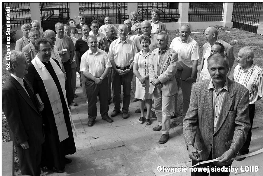
Otwarcie nowej siedziby ŁOIIB