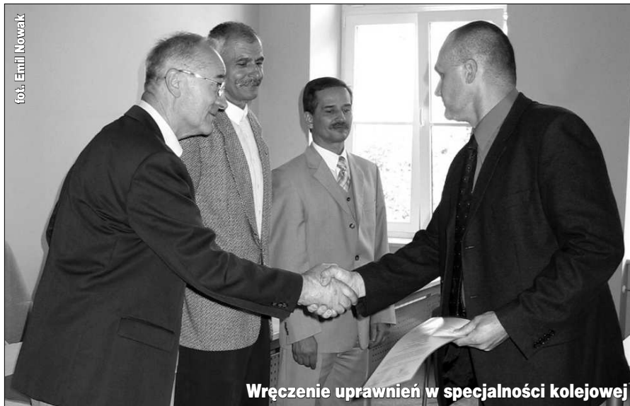
Wręczenie uprawnień w specjalności kolejowej

niczącego Rady ŁOIB skład orzekający podjął uchwały w sprawach: