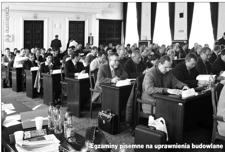
Egzaminy pisemne na uprawnienia budowlane