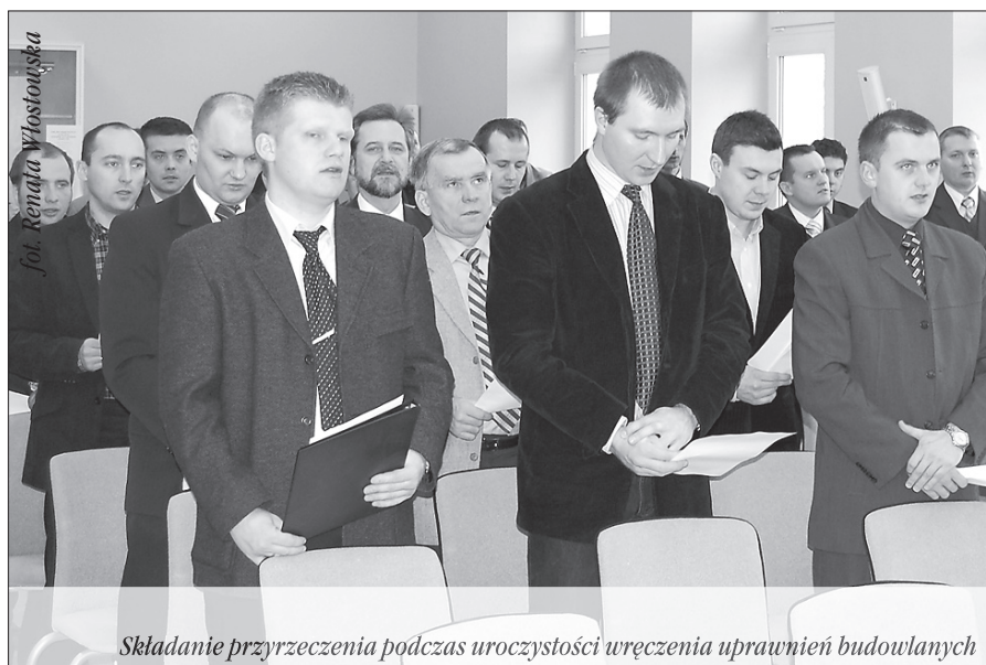
Składanie przyrzeczenia podczas uroczystości wręczenia uprawnień budowlanych