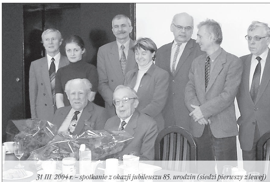
31 III 2004 r. – spotkanie z okazji jubileuszu 85. urodzin (siedzi pierwszy z lewej)