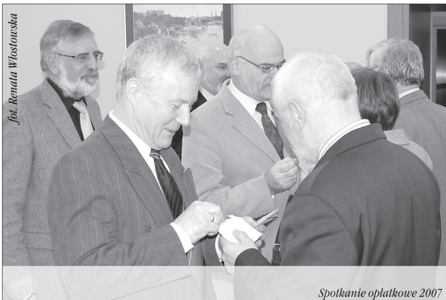
Spotkanie opłatkowe 2007